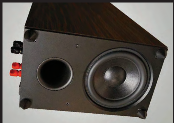
Der entscheidende Unterschied zur Vorgängerin 3.0: Bei der neuen 3.1 sorgt ein 22er-Langhub-Bass auf der Unterseite für Tieftondruck. Exzellent auch die Anschlüsse: Sie sind mit das Beste von Mundorf.