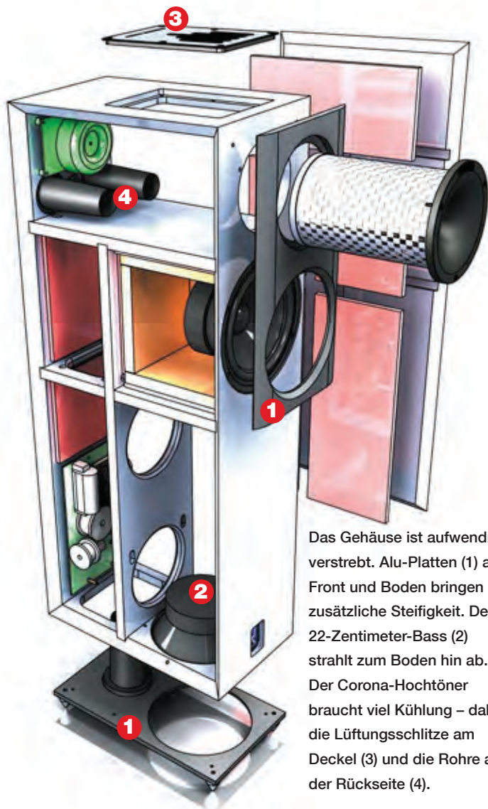
Das Gehäuse ist aufwendig verstrebt. Alu-Platten (1) an Front und Boden bringen zusätzliche Steifigkeit. Der 22-Zentimeter-Bass (2) strahlt zum Boden hin ab. Der Corona-Hochtöner braucht viel Kühlung – daher die Lüftungsschlitze am Deckel (3) und die Rohre auf der Rückseite (4).

Der Ionenhochtöner ist nach Jahren der Kinderkrankheiten erwachsen und überlegen gut geworden. Und die Lansche Audio No 3.1 ist derzeit die günstigste Möglichkeit, an einen stimmigen Lautsprecher zu gelangen. Noch Fragen? Holger Biermann ■